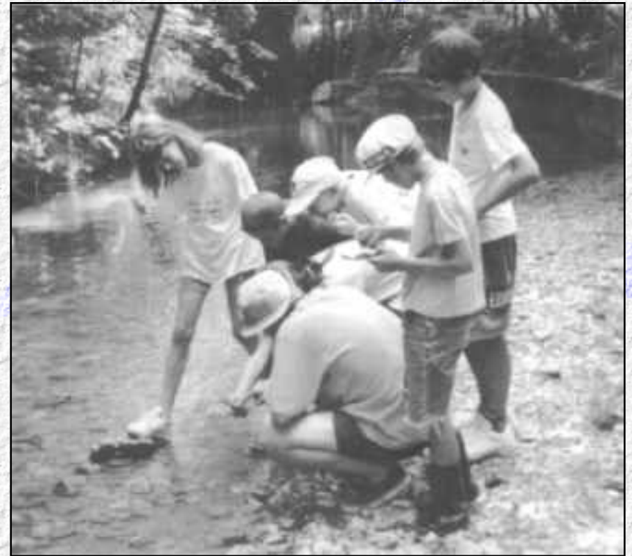
Opération Rivières Propres : des milliers de kilomètres parcourus...

Dans Lémaniques n° 21, publié en septembre dernier, nous vous avons déjà informé des difficultés que