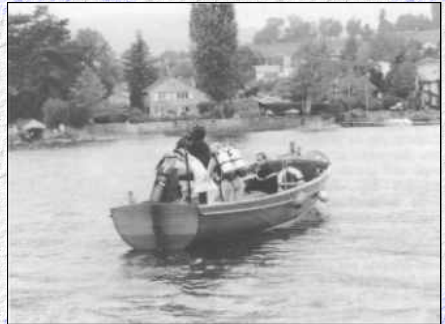
Opération Léman Rives Propres : 225 plongeurs et 70 bateaux pour prospecter les rives.

Les radios et télévisions ainsi que la presse écrite ont largement couvert cette manifestation, contribuant ainsi à la sensibilisation de la population lémanique aux problèmes de pollution du Léman. L'opération sera poursuivie et nous espérons la terminer dans le courant de cette année.