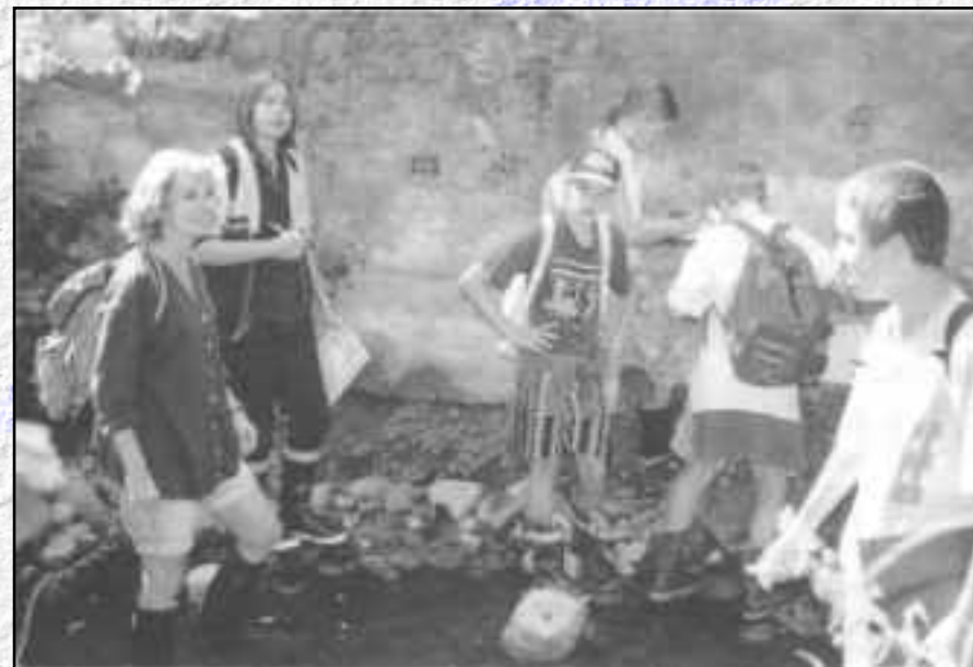
Passeports-vacances : sensibiliser les jeunes

Or, comme on l'a souvent répété, ce n'est pas parce qu'un individu voit sa fièvre passer de 40 à 38°C qu'il est guéri.