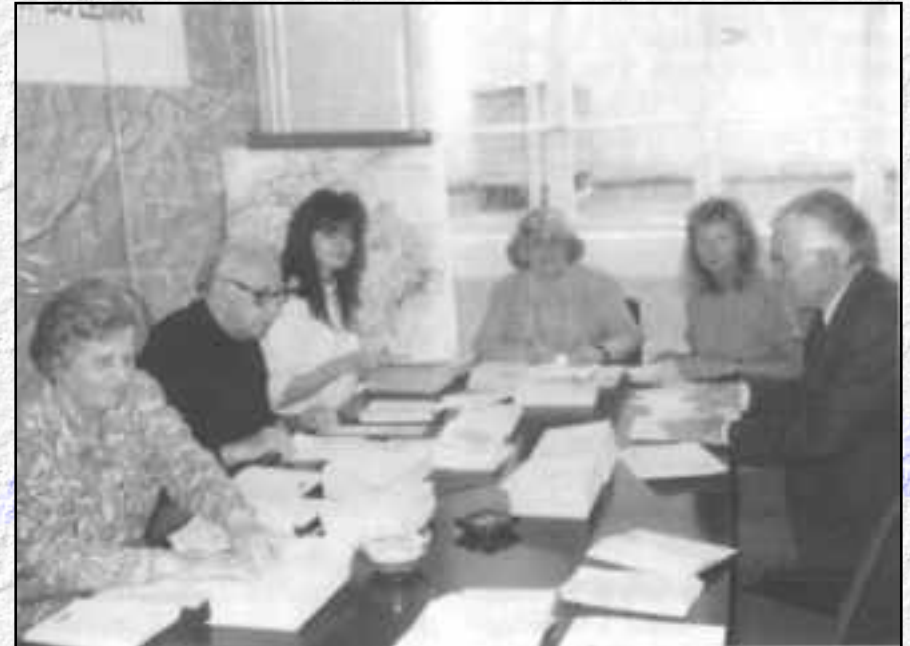
Le soutien fidèle et efficace des bénévoles.

Un merci tout spécial également à tous les bénévoles qui travaillent dans l'ombre et qui apportent leur