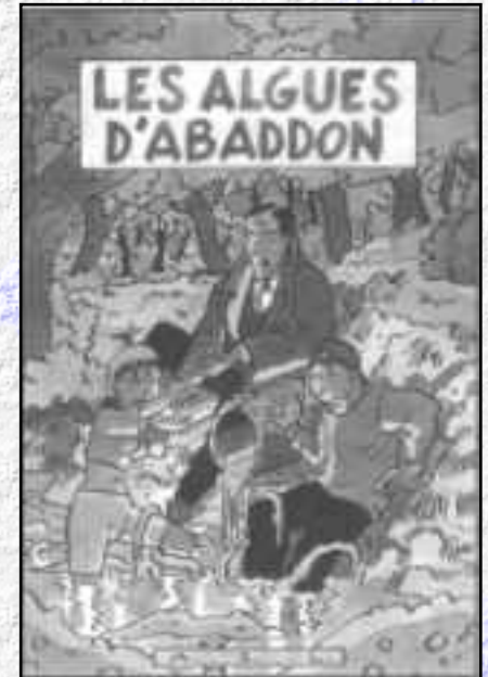
L'ASL en bande dessinée.

Comme par le passé, l'information du public et des élus a occupé une grande place dans les activités déployées par l'ASL. Cette information est d'autant plus importante que les messages d'amélioration de l'état du lac diffusés depuis quelques années sont compris par certains comme des messages de victoire dans la lutte contre la pollution des eaux du Léman. Ce n'est pas parce que le lac se porte mieux qu'il est guéri. La concentration en phosphore dans les eaux du lac, encore deux fois trop importante, et la disparition quasi complète de l'oxygène dissous au fond du lac à 300 m. sont là pour témoigner que nos efforts ne doivent pas se relâcher.