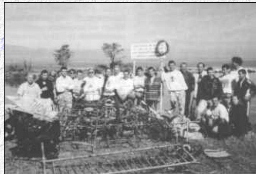
Le résultat d'une journée de nettoyage.

Une fois gagnée la bataille des phosphates dans les produits de lessive (interdiction intervenue en juillet 1986 en Suisse et limitation à 20% en France en 1991), bataille à laquelle l'ASL avait pris une part très active qui lui avait valu à l'époque une lettre de félicitations du Conseil fédéral, notre association s'est engagée dans un autre combat, peut-être moins médiatique mais tout aussi important : la lutte contre les pollutions diffuses d'origine agricole.