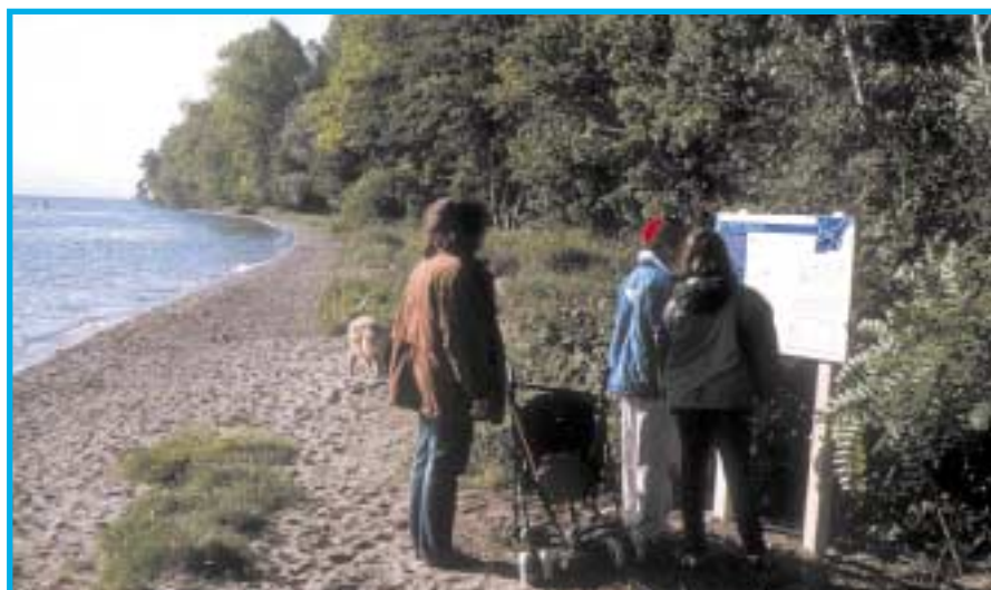
Le sentier-Nature en bordure du Léman et du Boiron, un outil didactique indispensable de sensibilisation du public aux beautés, mais aussi à la fragilité des écosystèmes aquatiques.

- Chaque rivière est unique. Il est donc fondamental, avant de se lancer dans un aménagement, d'étudier précisément l'état initial de la rivière afin de bien définir les facteurs limitants. Une solution ayant fait ses preuves dans une rivière peut apparaître totalement inadaptée dans une autre.