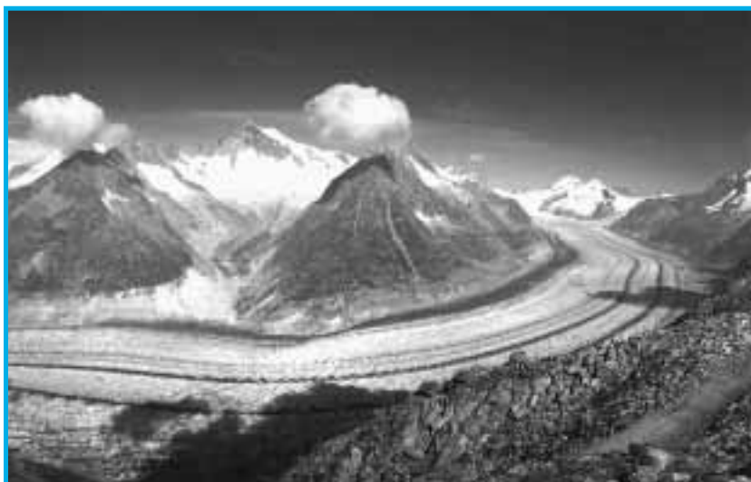
Le glacier d'Aletsch. Le plus grand: 96 km 2 , 900 mètres d'épaisseur, dévale de 4'140m à 1'520m d'altitude

En Suisse, nous savons que la tendance au réchauffement est 2 à 3 fois plus élevée que la moyenne globale, c'est-à-dire celle de toute la planète. De plus, les températures se sont particulièrement élevées dans les zones de montagne, en altitude.