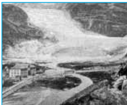
a) 1870: un recul déjà amorcé. in Mercanton (1916) (in A. Zryd 2001)

La cause de ces glaciations est toujours un sujet d'intense débat mais une chose est sûre, le climat passe du chaud au froid, de l'humide au sec avec une rapidité déconcertante. Depuis la fin de la dernière glaciation, voilà environ 10'000 ans, nous vivons un épisode interglaciaire, l'Holocène. L'homme en a-t-il profité pour domestiquer les plantes et les animaux, inventer les villes et le moteur à combustion et connaître ainsi le succès démographique que l'on sait? Un fait est certain: le quaternaire est une période d'instabilité caractérisée par d'importants changements d'environnement. Les faunes et les flores ont dû s'adapter ou disparaître. Chaque