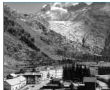
b) 1998: une relique! (in A. Zryd 2001)

glaciation effaçant les traces de la précédente, c'est la dernière, dite de «Würm», qui a façonné les paysages que nous connaissons aujourd'hui.