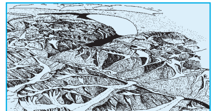
b) Il y a 14'000 ans, la vallée du Rhône est libérée mais un culot de glace stagne dans la cuvette lémanique

Le Valais avant l'histoire, catalogue d'exposition, musées cantonaux, Sion, 1986