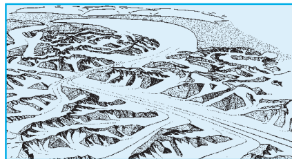
a) Il y a 20'000 ans environ, pendant la déglaciation, le glacier du Rhône arrive jusque dans la région genevoise

l'on tente de régionaliser, pour les adapter aux différentes régions du globe. Les modèles sont une sorte de schématisation et donc, par définition, une simplification de la réalité qui est beaucoup plus complexe. Mais c'est l'outil principal dont nous disposons. Cet outil nous donne des résultats qui, comme toute prévision, ont une marge d'erreur et un certain degré d'incertitude. Pour un chercheur, l'incertitude est la don-