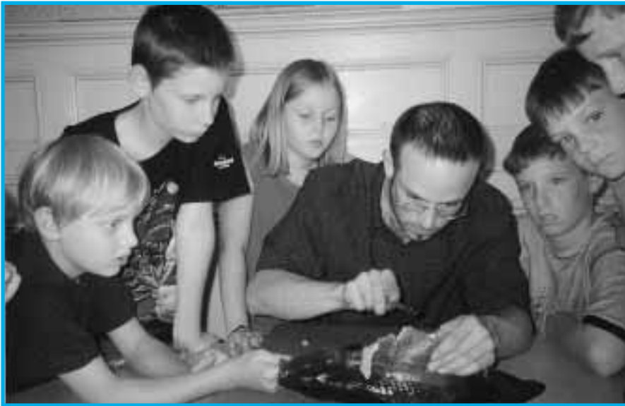
Après la pêche matinale et avant la dégustation, dissection de la carpe au camp de vacances animé par l'ASL l'été dernier.