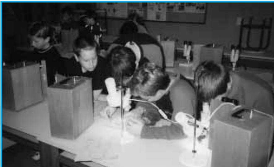
Le passeport vacances de Morges a de nouveau attiré en octobre dernier les jeunes passionnés de nos rivières et du Lac – ici en train d'observer attentivement des micro-organismes.